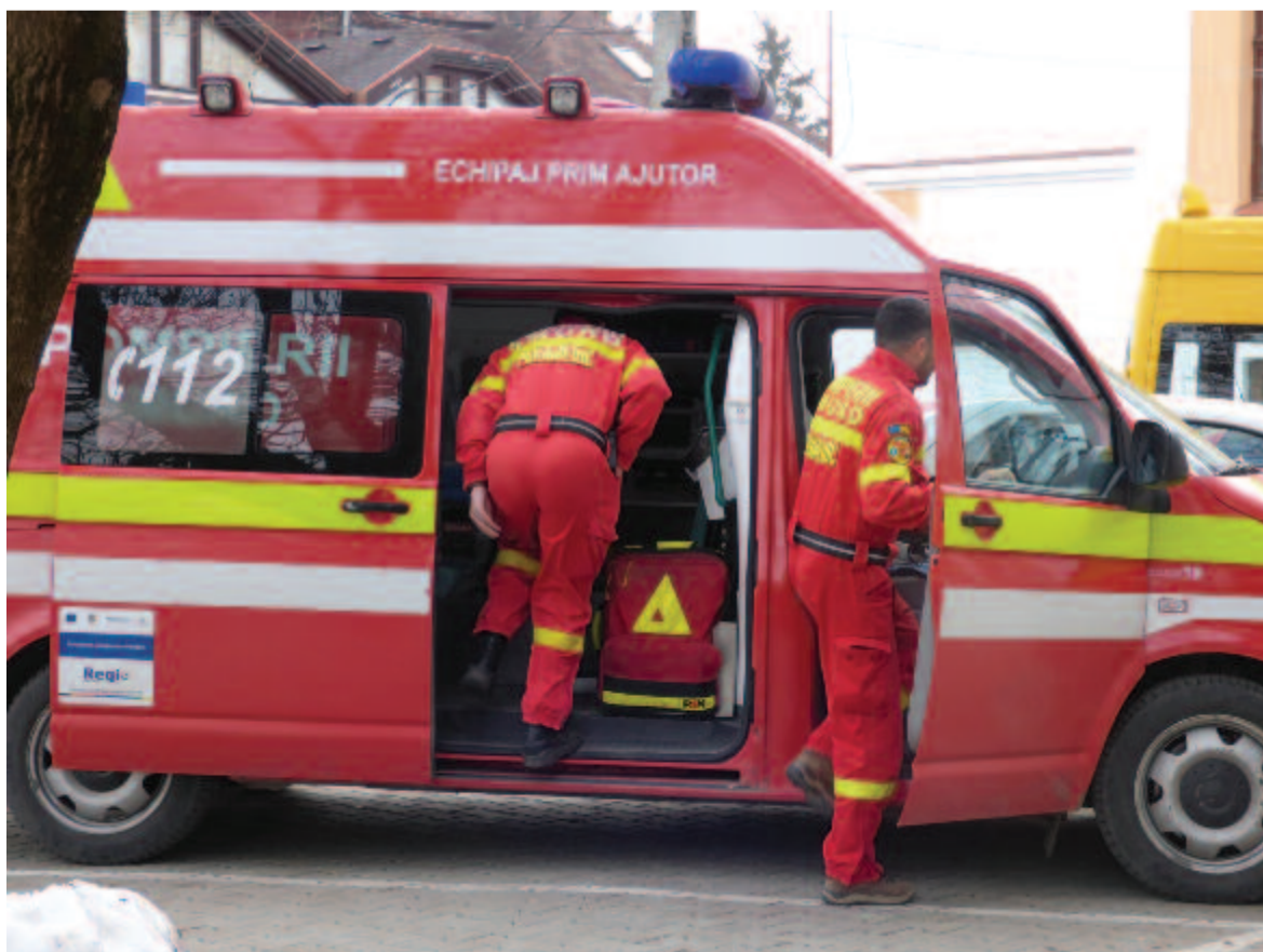
Sokszor vették igénybe a szeredai egységet a tavaly is, és ez a szám növekszik

Ami a számadatokat illeti: a szeredai egységet a tavaly összesen 728 alkalommal riasztották, ebből az általa kiszolgált területen Nyáradszeredában 229, Nyáradgálfalvára 129, Nyáradremetére 110, Nyáradmagyarosra 62, Székelyberére 43, Csíkfalvára 80, Székelyhodosra 25, Backamadarasra 14, Havadra 9 alkalommal szálltak ki. Ezenkívül Jeddre kilenc, Ákosfalvára öt, Szovátára és Gyulakutára négy-négy, Marosvásárhelyre három, Gernyeszegrre két, Nagyerénybe és Székelyabodba egy-egy alkalommal irányította őket a diszpécser szolgálat.