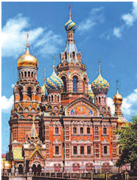
A Vértől Megváltó templom

A szentpétervári Kazán katedrális, jelenleg érseki székhely meglátogatása következett. A 19. század elején épült templom mintájaként a római Szent Péter-bazilika szolgált, ezért