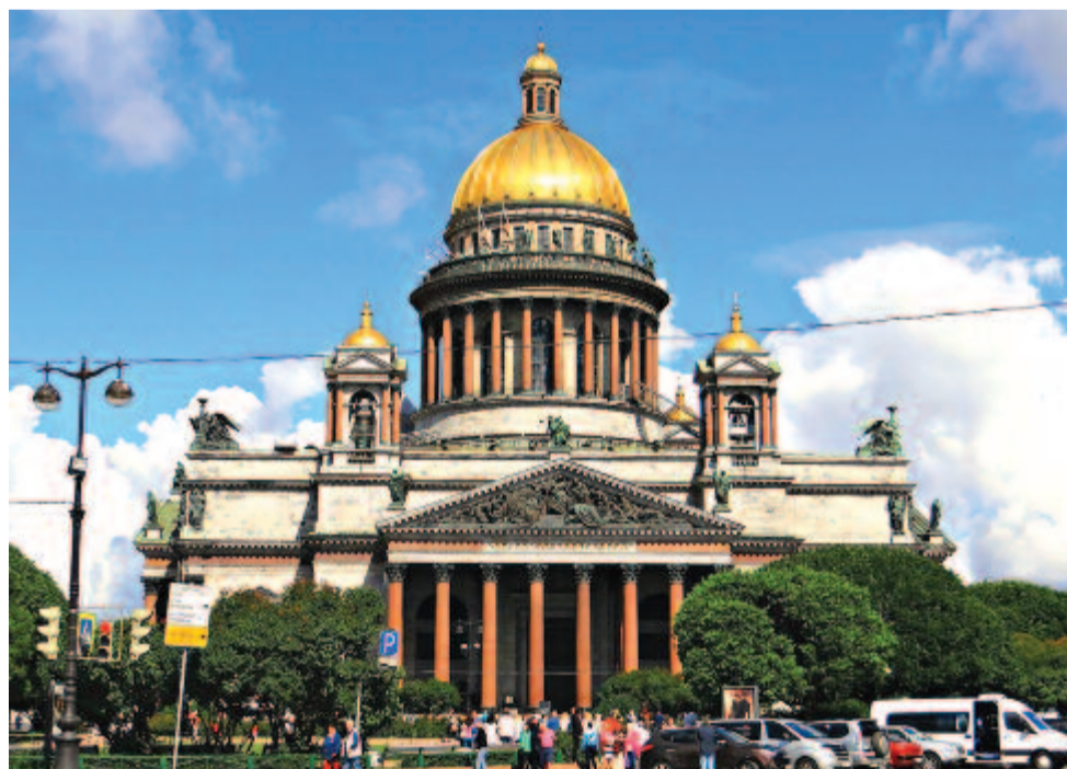
A Szent Izsák-székesegyház Szentpéterváron