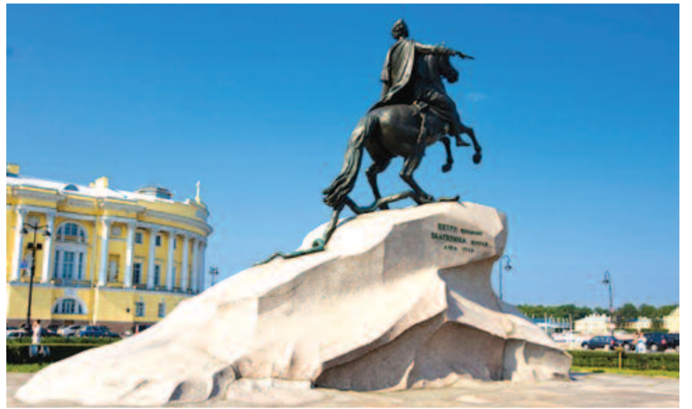
Nagy Péter cár lovas szobra

Szentpétervár és Pavlovszka között nyitották meg.