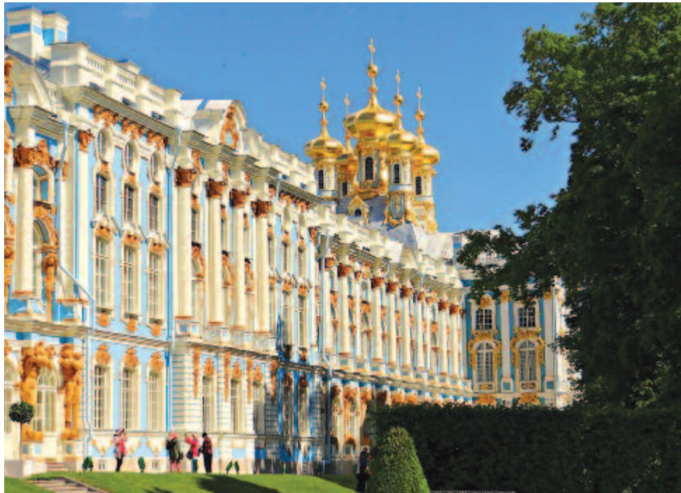
Nagy Katalin palotája Puskinban

Szentpétervár környéken 20–30 kilométeres körzetben I. Nagy Péter cár után majdnem minden cár építtetett saját örömeire egy-egy fényűző palotát.